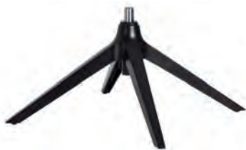
Drehschemel Schwarz matt für Typ -10/-11