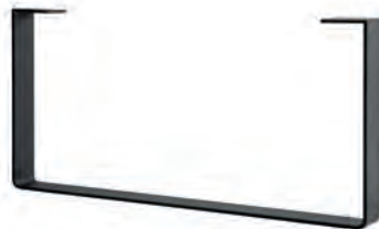
Alternativ-Kufe Kufe Schwarz Struktur