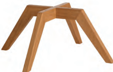
Drehschemel Eiche für Typ -10/-11

Der Fuß und der Drehschemel sind nur Eiche geölt bzw. Eiche bianco möglich!